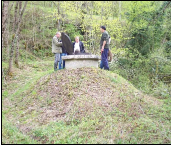
Visite d'un puits avec l'hydrogéologue agréé et les élus