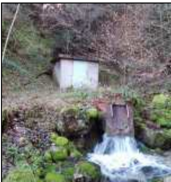
Captage d'une source et son trottoir-plein